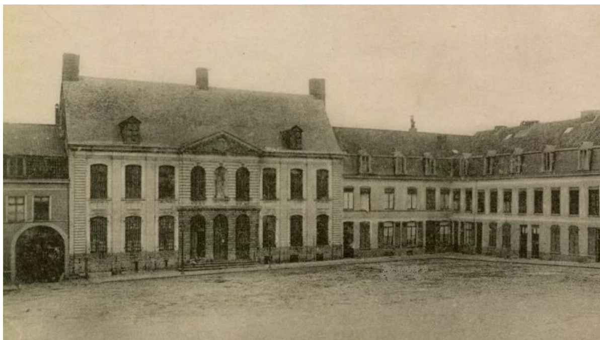
La Place Plichon, Bailleul

Nous avons le plaisir de vous inviter à l' ASSEMBLEE GENERALE ORDINAIRE pour l'année 2023 qui aura lieu le Samedi 16 MARS 2024 dès 9h30, dans la grande salle Chez Régis, 128 rue Philippe Van Tieghem, à Bailleul